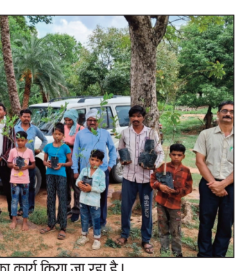
विदिशा। झिरी गांव में पौधे लगाने का कार्य किया जा रहा है।