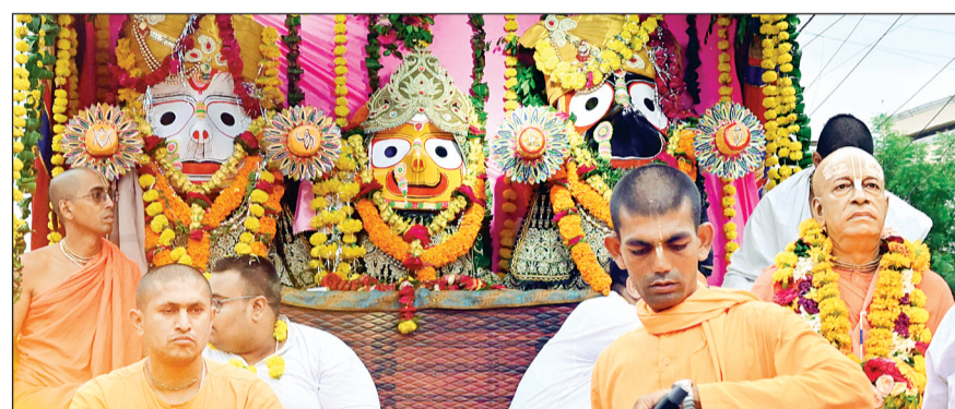
विदिशा। भगवान जगन्नाथ, बलभद्र, सुभद्रा के विग्रह की निकाली रथयात्रा।

मानोरा के साथ विदिशा शहर में इस्कॉन, नदवाना, द्वारकाधीश मंदिर सहित पूरनपुरा से निकले रथ हरिभूमि न्यूज ▶▶▶ विदिशा