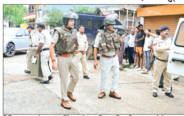
विदिशा। घटना के समय सॉरिंग करते हुए पुलिस अधिकारी। फाइल फोटो